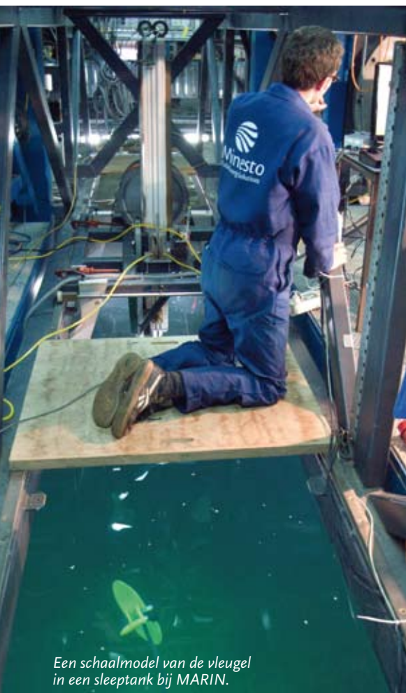
Een schaalmodel van de vleugel in een sleeptank bij MARIN.